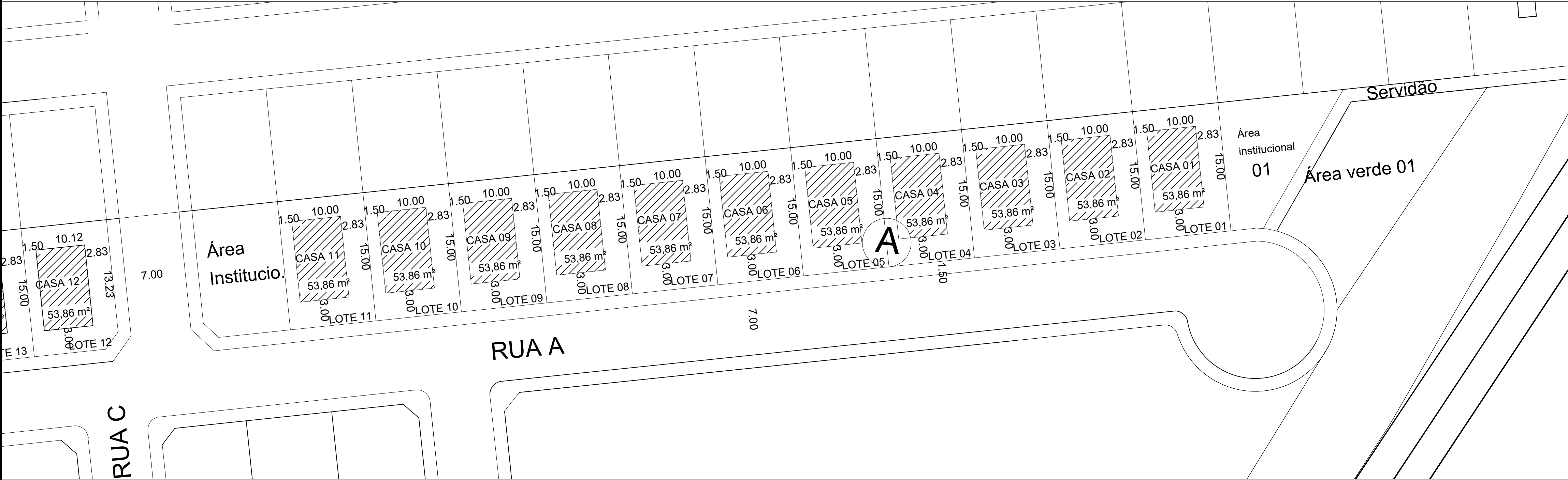
1 IMPLANTAÇÃO LOTES QUADRA A ESCALA 1/300