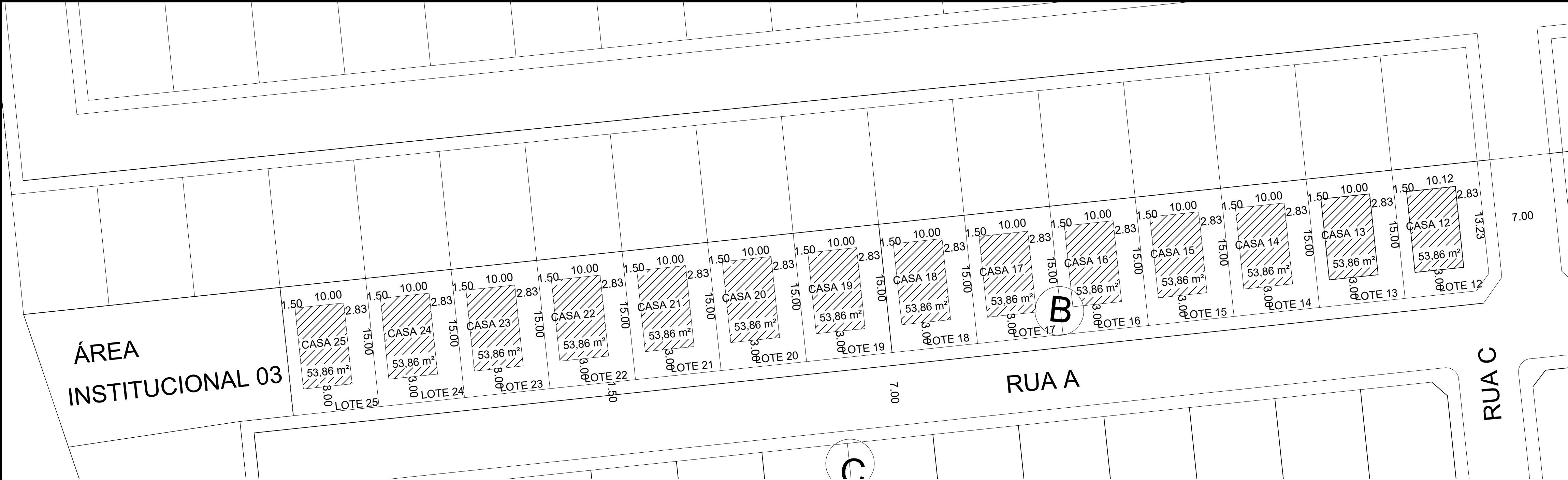
1 IMPLANTAÇÃO LOTES QUADRA B ESCALA 1/300